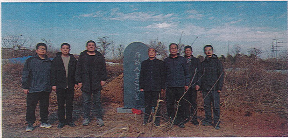
众筹立碑人员在“王之涣墓”前合影