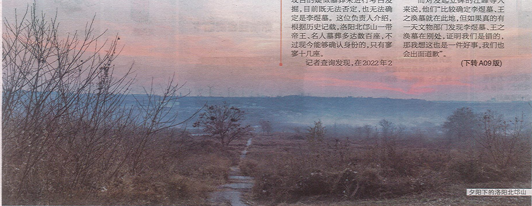
夕阳下的洛阳北邙山