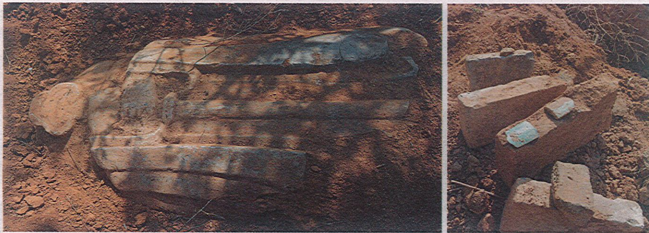
老坟台一带挖出的石像生、古砖、琉璃瓦(摄于2013年)