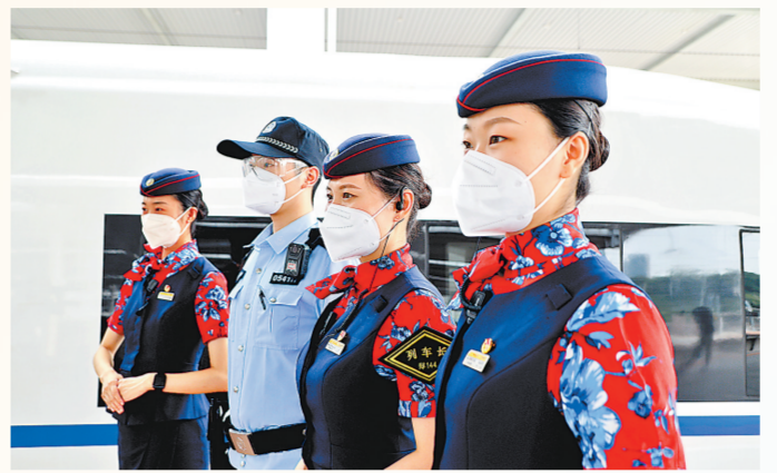
6月20日,G3401次列车抵达重庆北站,列车乘务班组合影留念。⑨6