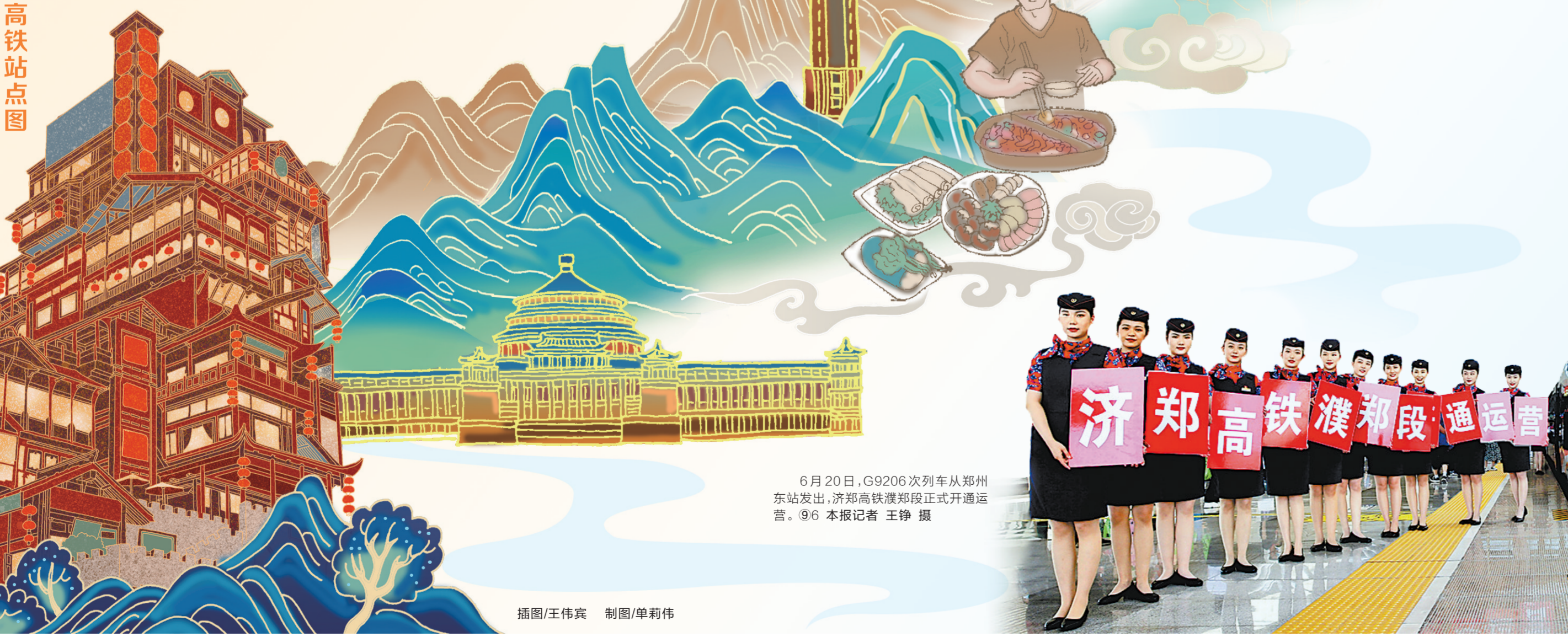
6月20日,G9206次列车从郑州东站发出,济郑高铁濮阳段正式开通运营。⑨6