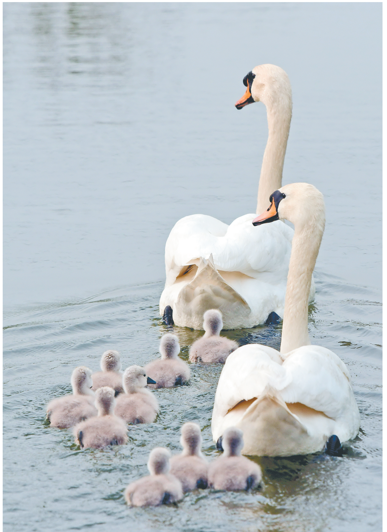
2022年4月11日，天鹅家族三胎降生，九胞胎鹅宝宝们受到郑州市民的喜爱。