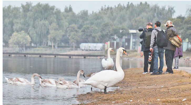
2020年10月17日，渐长渐大的小天鹅与郑州市民和谐相处。为了鹅家安康，郑州市民、爱鸟协会工作人员、摄影爱好者等多方人士为了天鹅“家园”秩序，付出了诸多努力。