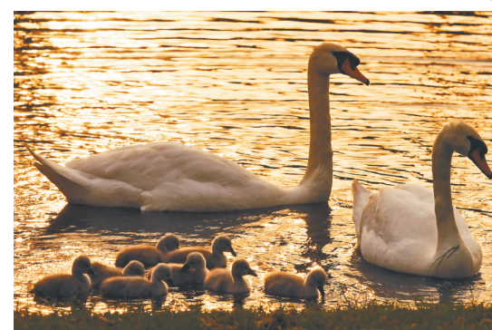
2022年4月11日，夕阳西下，两只大天鹅带着9只小天鹅在水里自由自在地游弋，小天鹅不时爬到鹅妈妈的翅膀下面，十分可爱、和睦。