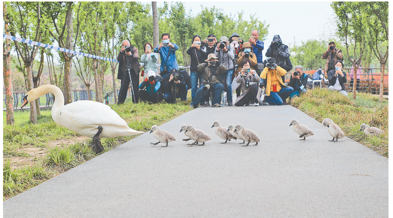
2022年4月14日，天鹅们悠然自在地穿越马路——“我的地盘我做主”。人们已经形成保护天鹅生活环境、自觉维护自然秩序的习惯。