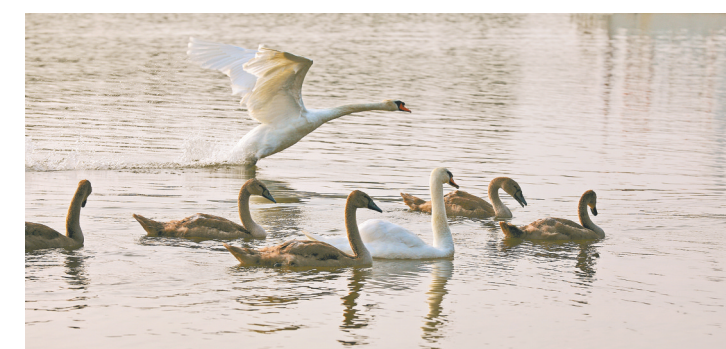
2021年7月，“王子”“公主”的二胎宝宝初长成，天鹅家族壮大。

4月14日早上，这几天郑州热度最高的网红——那对疣鼻天鹅夫妇，又开始带着它们的第三窝9只天鹅宝宝摇摇摆摆走出湿地里的鸟窝，走向北龙湖。他们的出现堪比T台服装秀，围观的爱鸟人士的相机快门不停，注视着它们踏着朝阳的脚步，一路向前。