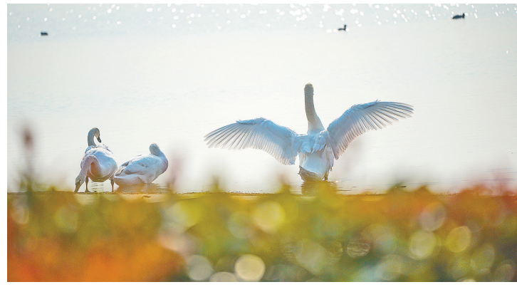
2020年底，晚秋在北龙湖天鹅惬意无比。他们已经爱上了这片家园，虽然是候鸟，这个冬天它们留在郑州越冬。