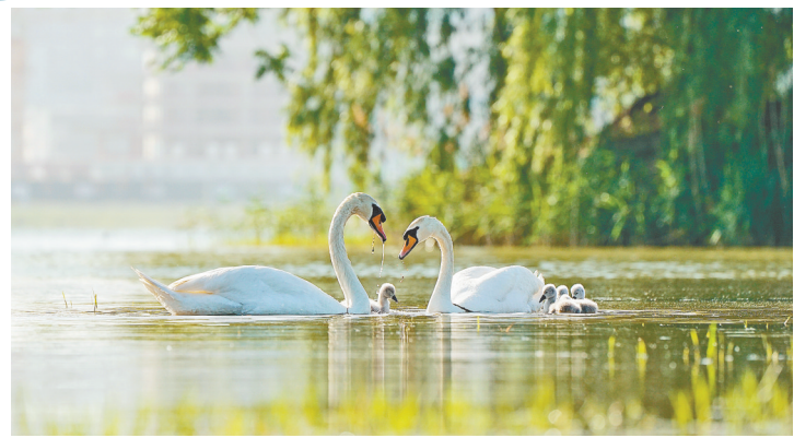
2020年5月18日，疣鼻天鹅夫妇和它们的第一窝宝宝。随后的几个月，它们一家在郑州人关注和帮助下怡然生活，直至小天鹅自立。