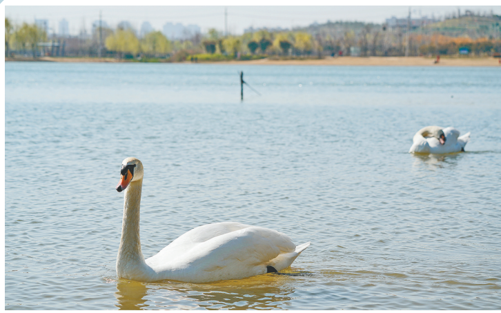
2020年2月，疣鼻天鹅夫妇初来乍到，对周围的一切充满警惕，常常在觅食进食时相互为对方放哨警卫。