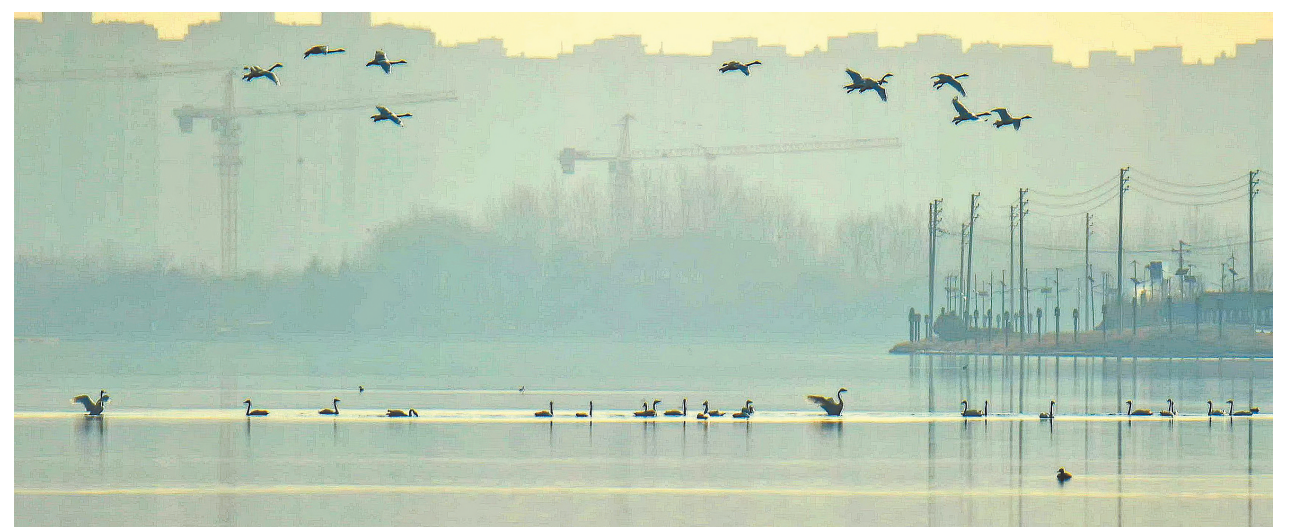
随着北龙湖环境越来越好，天鹅家族“鹅丁兴旺”，一个家族二三十口遨游北龙湖……