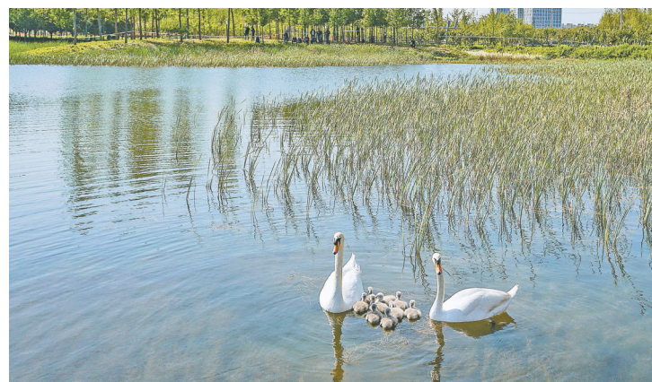
2021年4月19日，天鹅夫妇带领二胎宝宝下水。